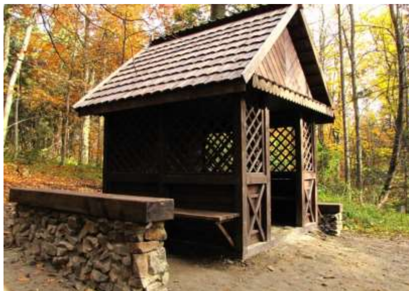
- Nowa Słupia oddz. 79 c (O.O. Święty Krzyż – Rampa)